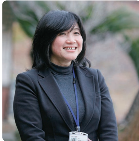
びわこ学園 医療福祉センター草津