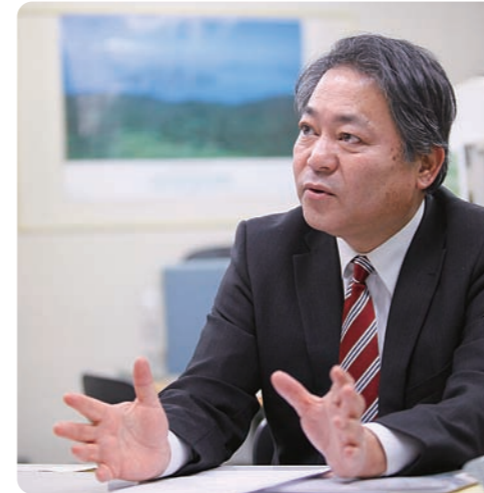
夢ツーリスト きたみ

びわこ学園は、重度の知的障がい、身体障がいを併せ持つ人たちが生活する入所施設です。利用者様の日常生活の介護や外出・余暇等の支援はもちろん、短期入所や通所、ヘルパー派遣、訪問介護、相談支援などのサービスも行っています。利用者様の年齢は1歳のお子さんから70代の方まで本当にさまざま。それぞれの障がいに特性があり、発達も違います。だからこそ、お一人おひとりに合った身体的な介護技術だけでなく、毎日楽しく過ごし、生きがいを感じてもらえるためのコミュニケーション能力が求められます。大切なのは、「その人が生きている世界」をいかに理解できるかということ。そこに、現場経験や関わる時間の長さには関係ありません。同じ目線・立場に立って、うれしいことを一緒にうれしと感じ、苦しみも感動も分かち合うことのできる姿勢が大事なのです。これから介護福祉業界をめざす皆さんには、学校で学んだ力を実践力に変え、創造力を持って挑戦できる人になってもらいたいですね。学生時代に色々な体験を積み上げ、さまざまな人と関わりを持ちながら、豊かな感情交流を深めていってください。