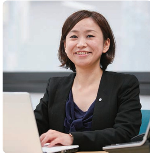
株式会社スーパー・コート 本学と産学連携協定を締結

その歴史と実績から「介護に強い短大」として評される華頂短期大学。介護業界の最前線で活躍される方々からメッセージをいただきました。