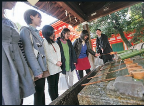
手水鉢には、ほとんど誰も気づかない「感神院」の文字が。