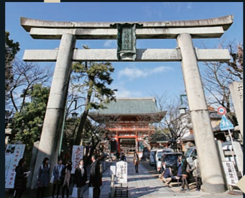
大通りに面した西の門ではなく、実は南側の門が正門という事実も。現在「八坂神社」の額が掛かっているが、江戸時代の絵図には「感神院」の文字が見られる。