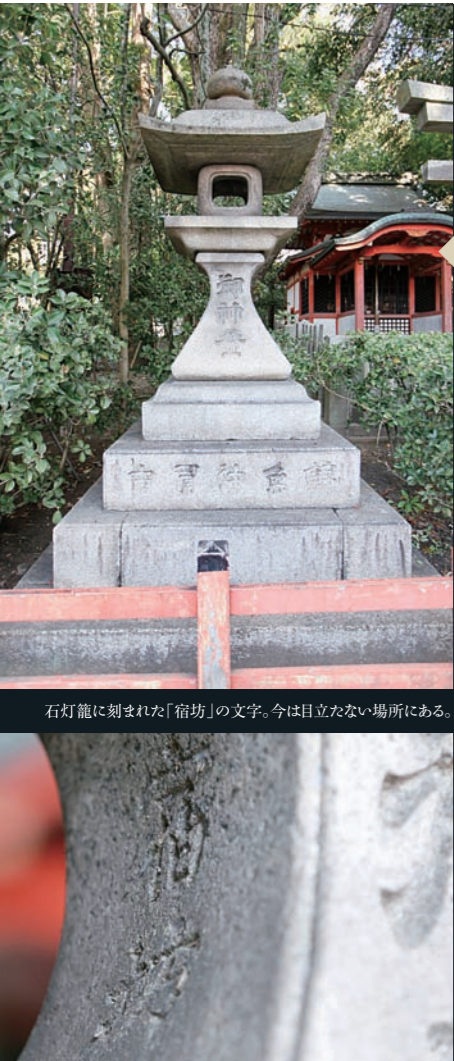
石灯笼に刻まれた「宿坊」の文字。今は目立たない場所にある。